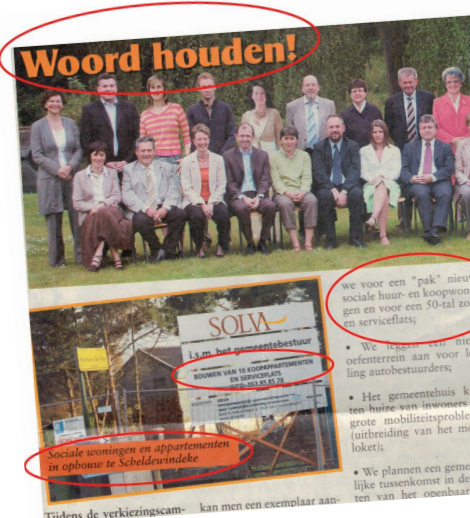
CD&V beloofde in 2006 in haar eigen partijbladje dat er op de site pastorie van Scheldewindeke serviceflats en sociale appartementen zouden komen... Hielden zij woord?