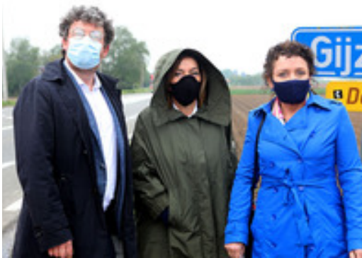
Minister Peeters kwam op vraag van Filip Michiels op werkbezoek

Vlaams minister van Mobiliteit en Openbare Werken Lydia Peeters bezocht op 15 mei de N42. Alom gekend als onveilige weg: er gebeurden 220 ongevallen in de laatste 15 jaar. Daar wil minister Peeters verandering in brengen: "Ik ben meer dan ooit overtuigd: we gaan de N42 ombouwen tot een vlotte en veilige verbindingsweg en dat met zo weinig mogelijk impact op landschap en omgeving. We hebben ook aandacht voor fietsers en duurzame mobiliteit. Verkeersveiligheid is een van mijn prioriteiten." Vlotter verkeer betekent niet alleen een goede verbinding richting E40 of de buurgemeenten, maar ook minder sluipverkeer op lokale wegen. De prognoses voorspellen nadien tot 60% minder sluipverkeer. Er wordt ingezet op verkeers-veiligheid, minder fijn stof en geluidshinder in de woonkernen.