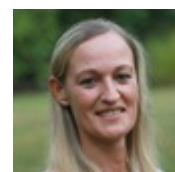
An Haesebeyt Lid BCSD (sociale dossiers)

Wil je samen met ons bouwen aan een mooier Oosterzele en beter land?